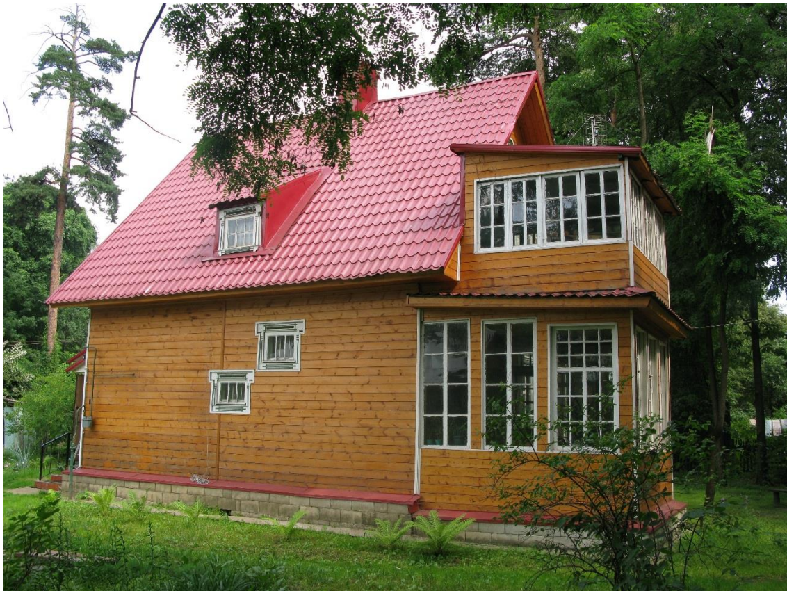
Вид с западной стороны