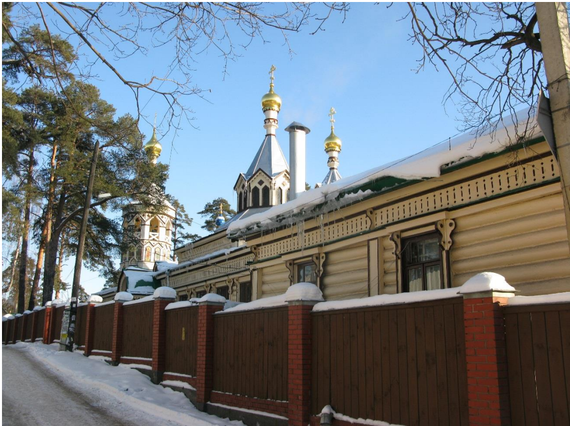
Вид с юго-запада (Пионерский пер.)