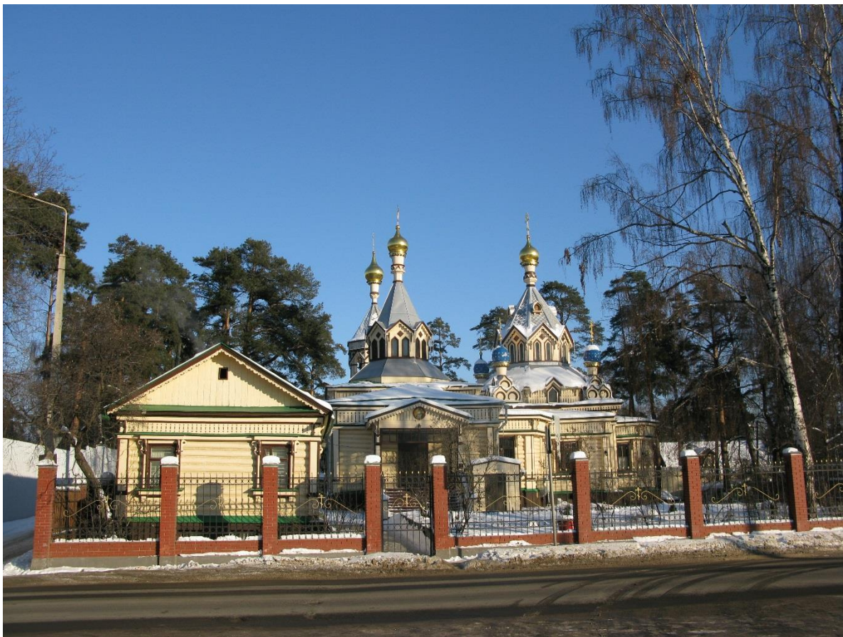
Вид с юга (ул. Интернациональная)