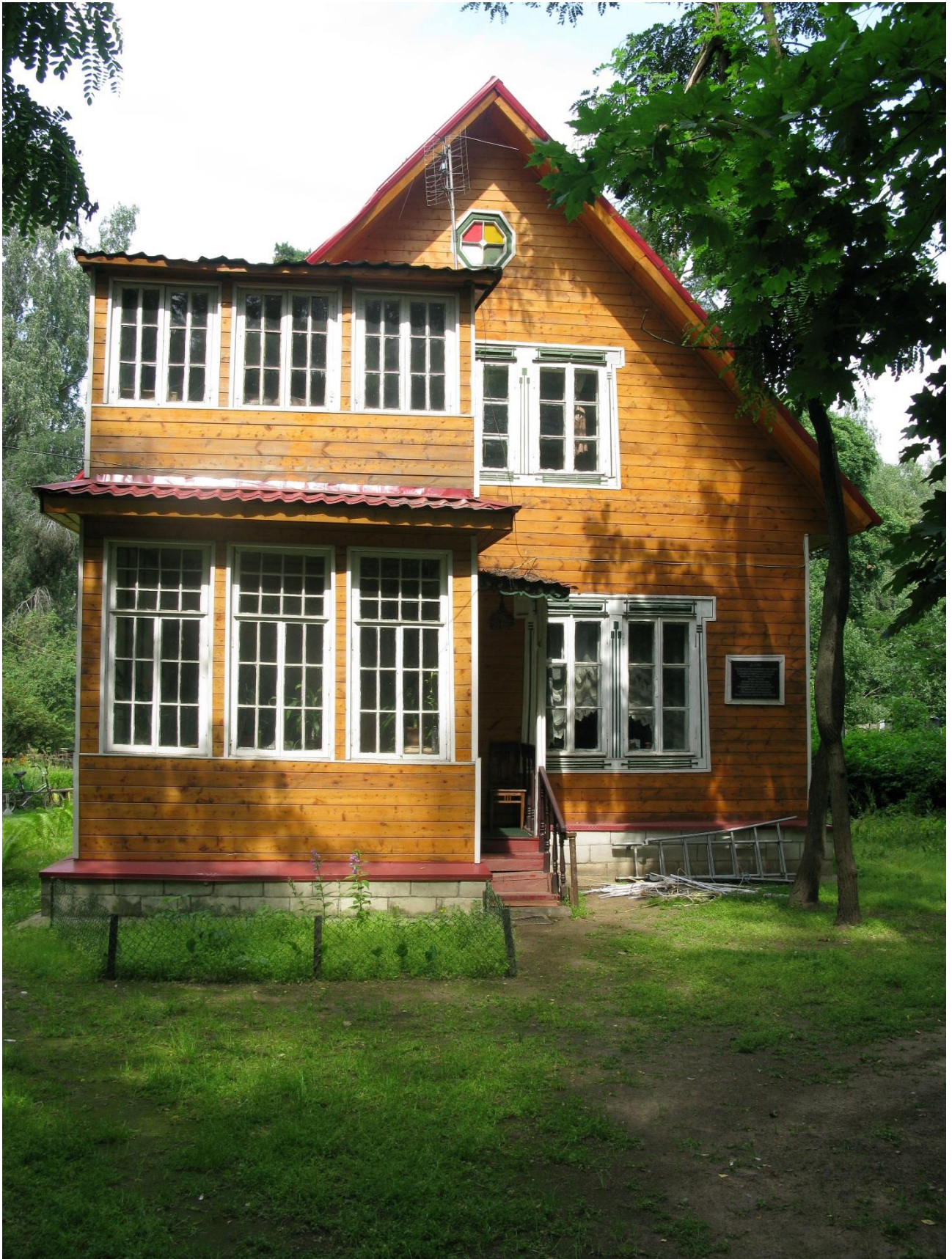
Вид на главный фасад дачного дома с южной стороны