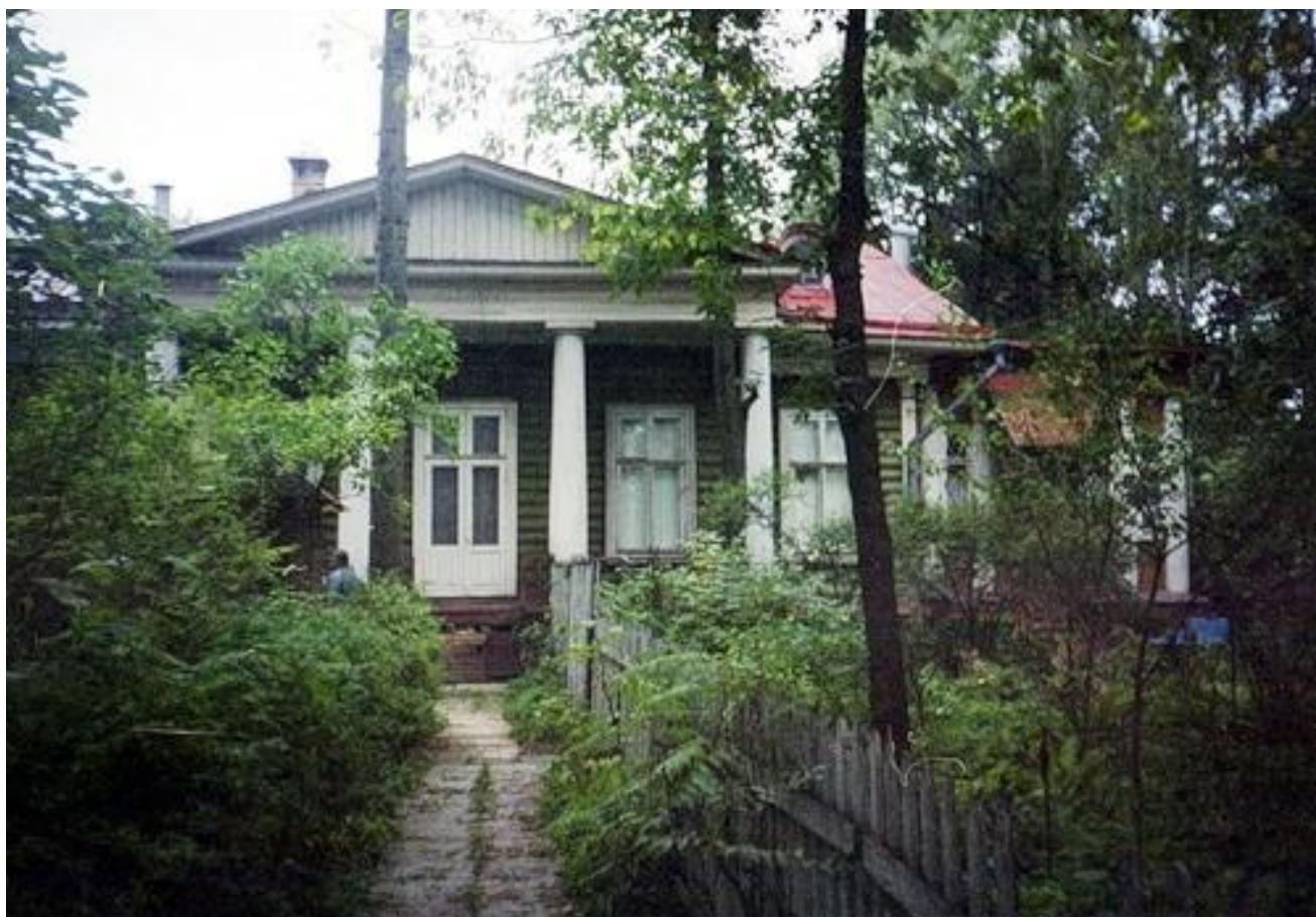
Вид на главный фасад с северной стороны (фотография 1995 г.)