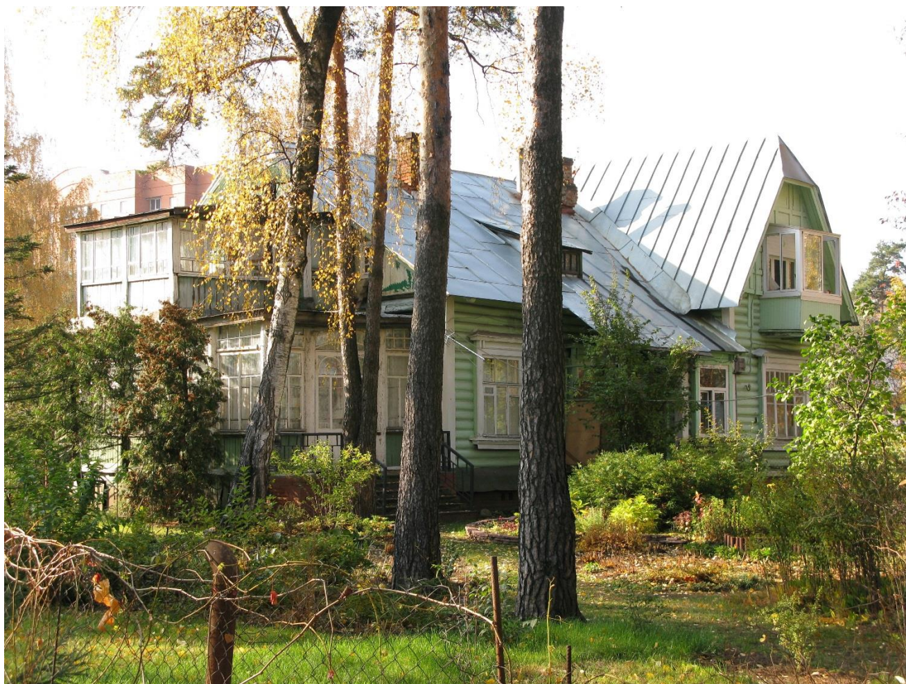
Вид с северо-восточной стороны