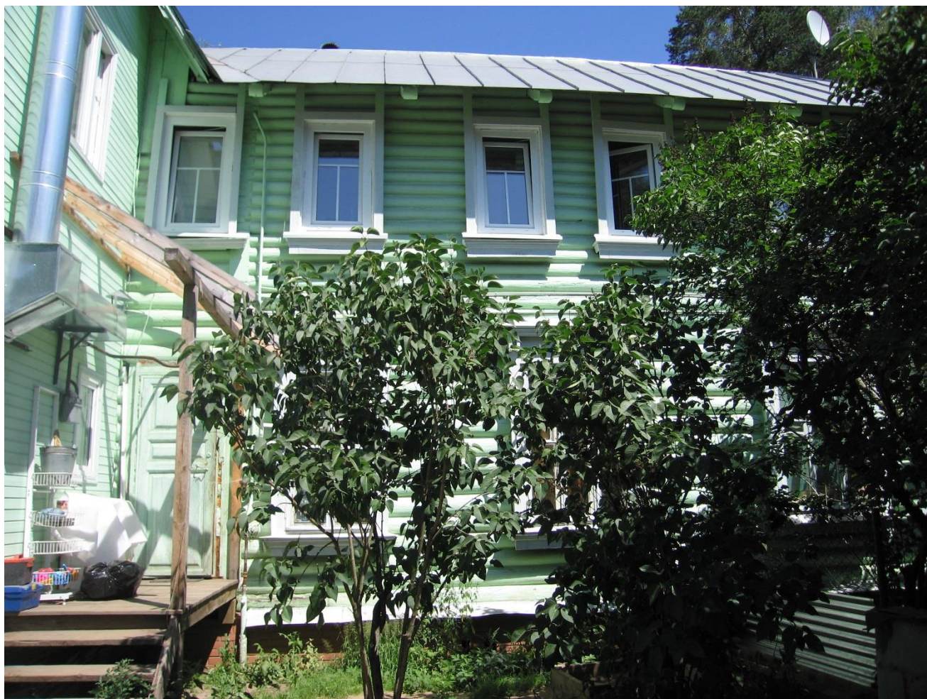
Вид с южной стороны