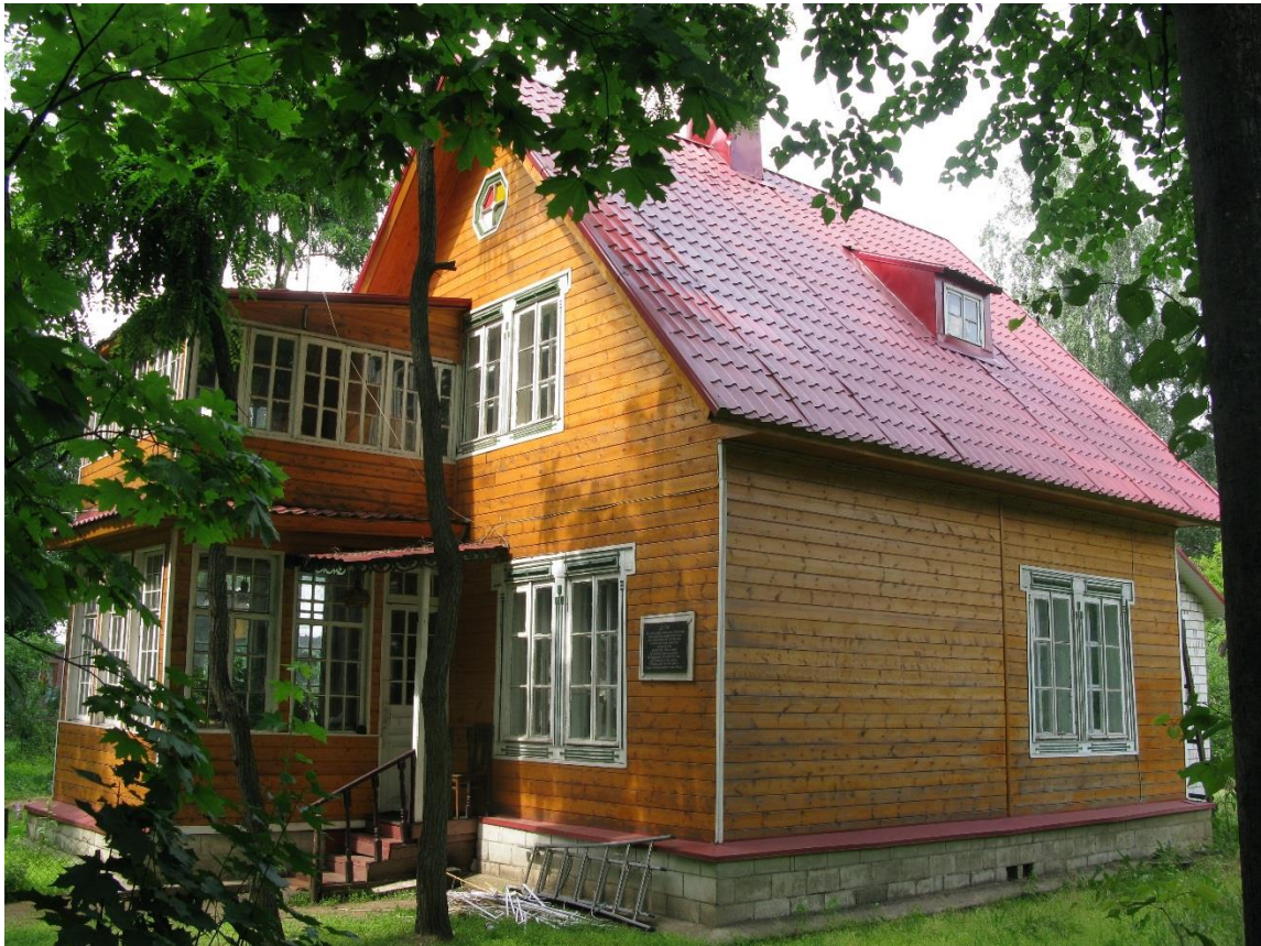
Вид с юго-востока