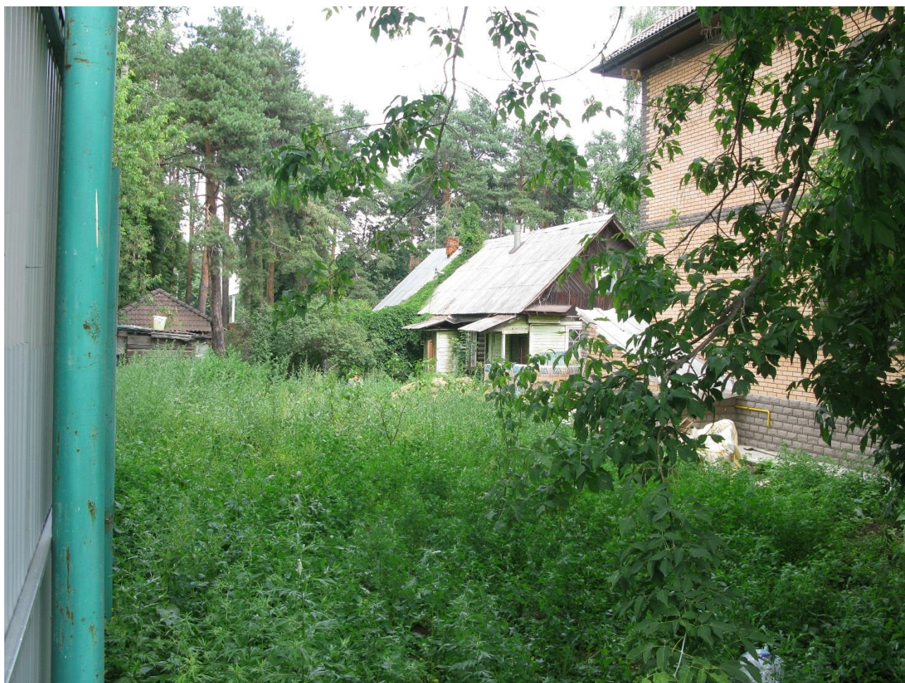
Вид на памятник с юго-запада