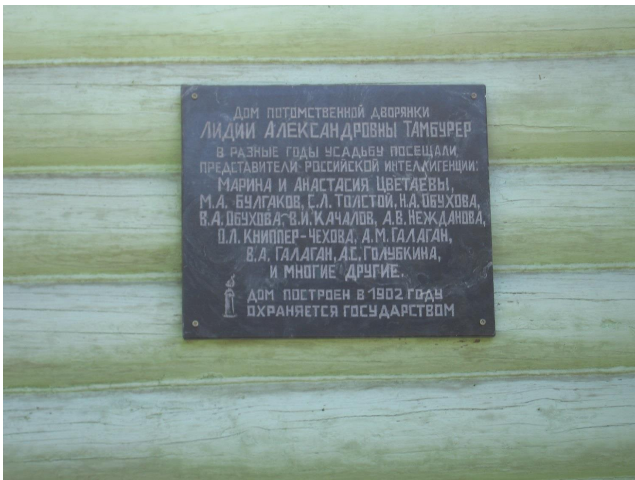
Мемориальная доска на западном фасаде