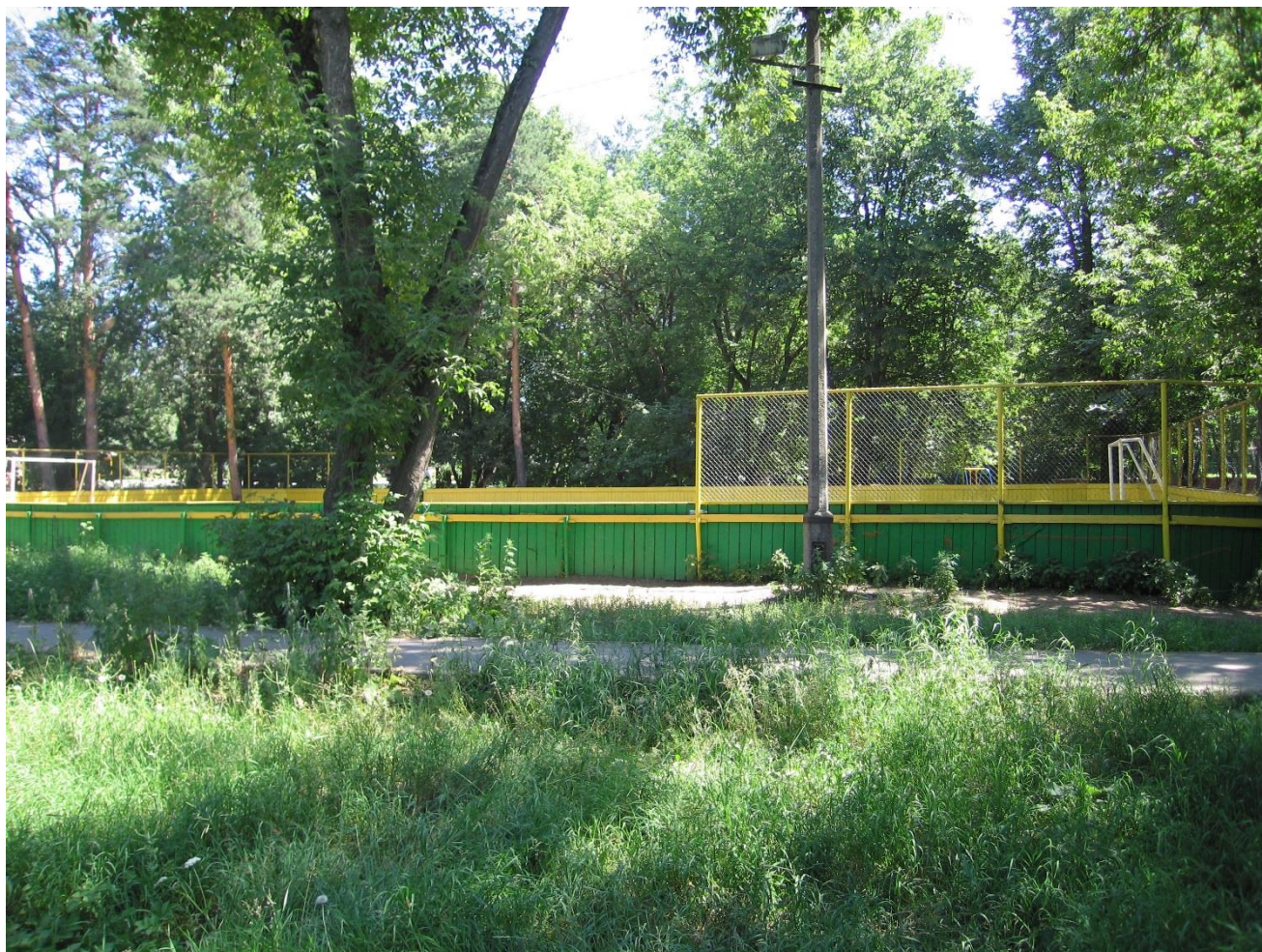
Вид с запада на игровую спортивную площадку (стоял дом № 13) и сквер (стоял дом № 12)