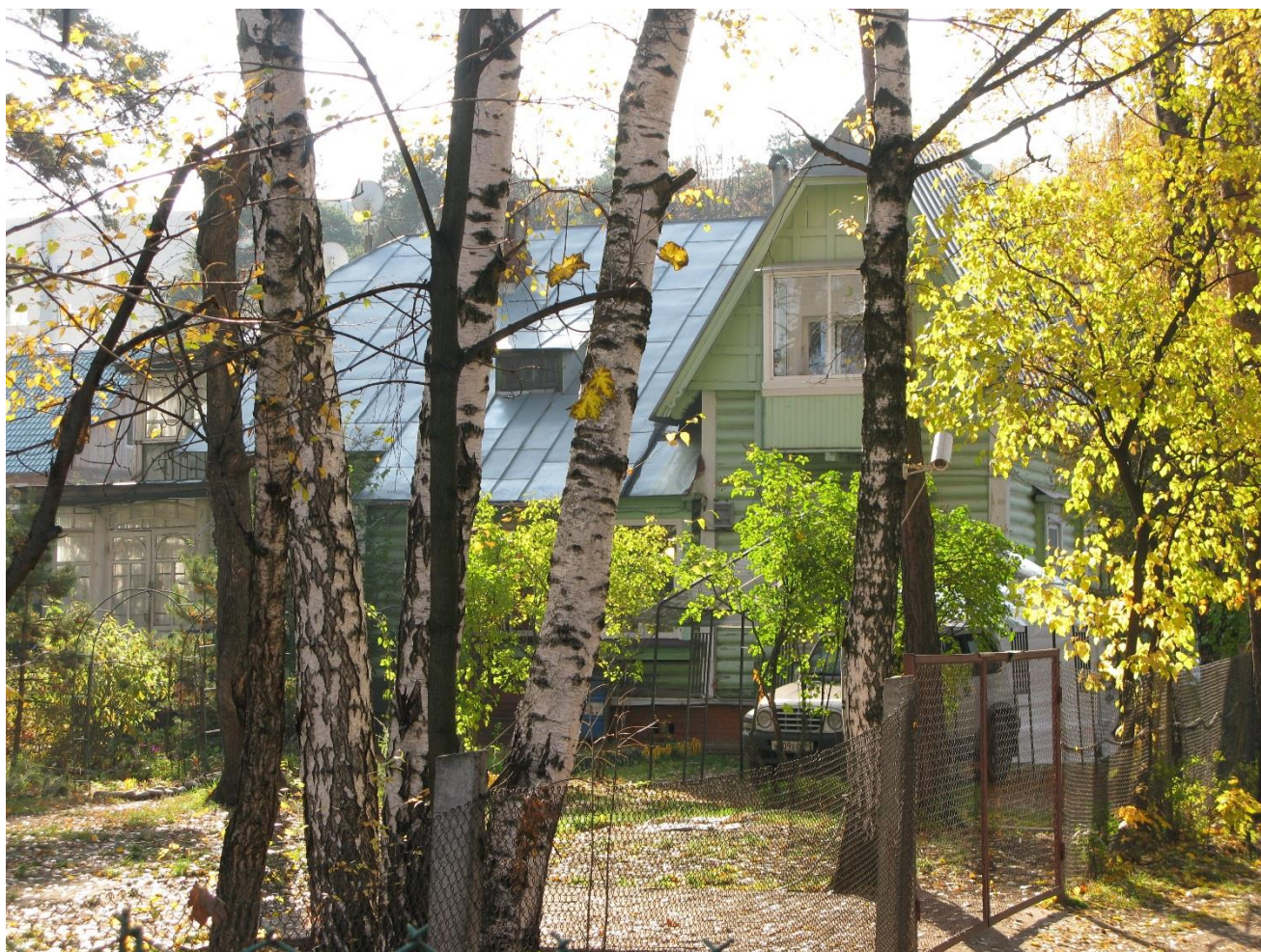
Вид с северной стороны