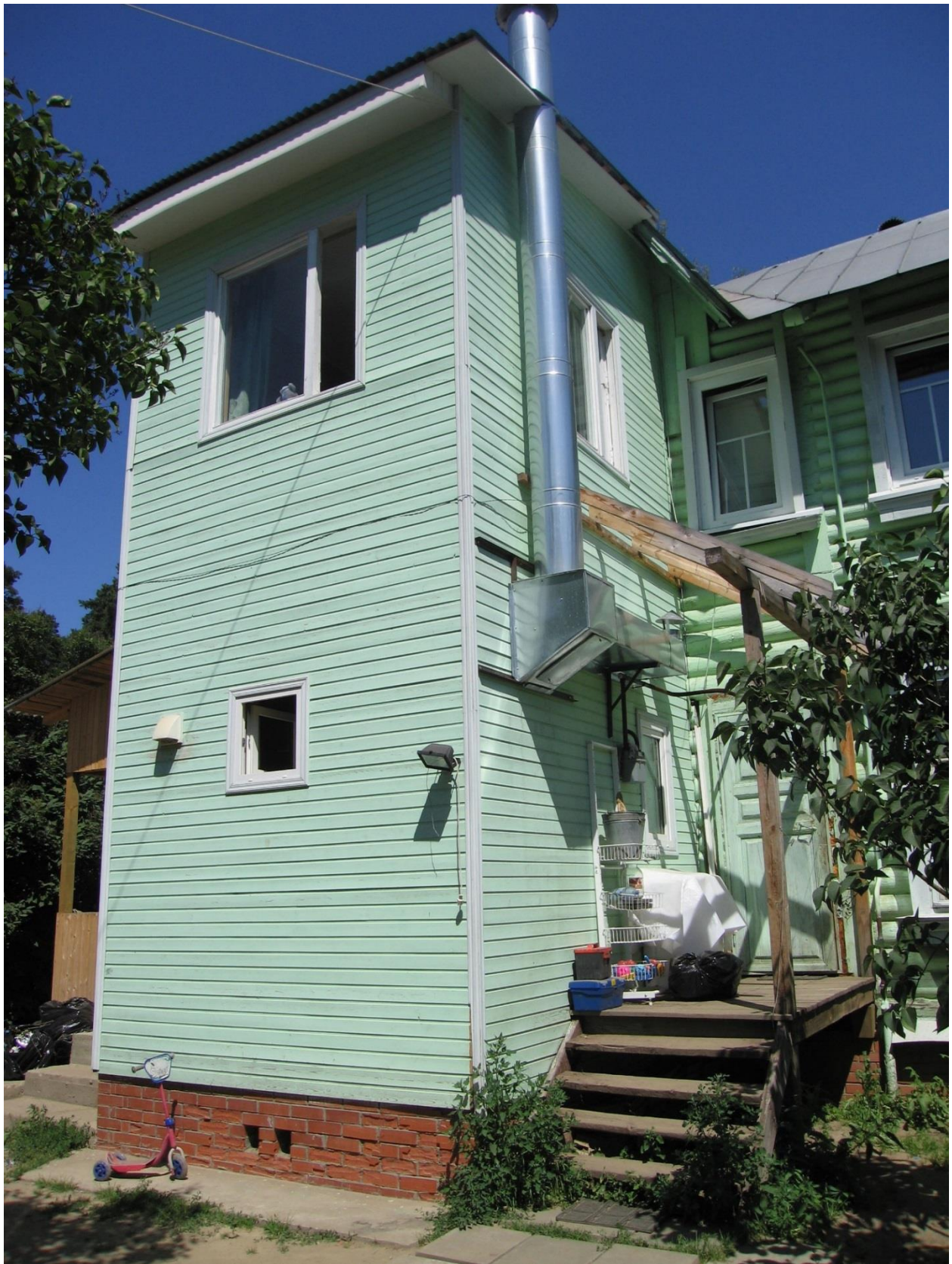
Фрагмент южного фасада