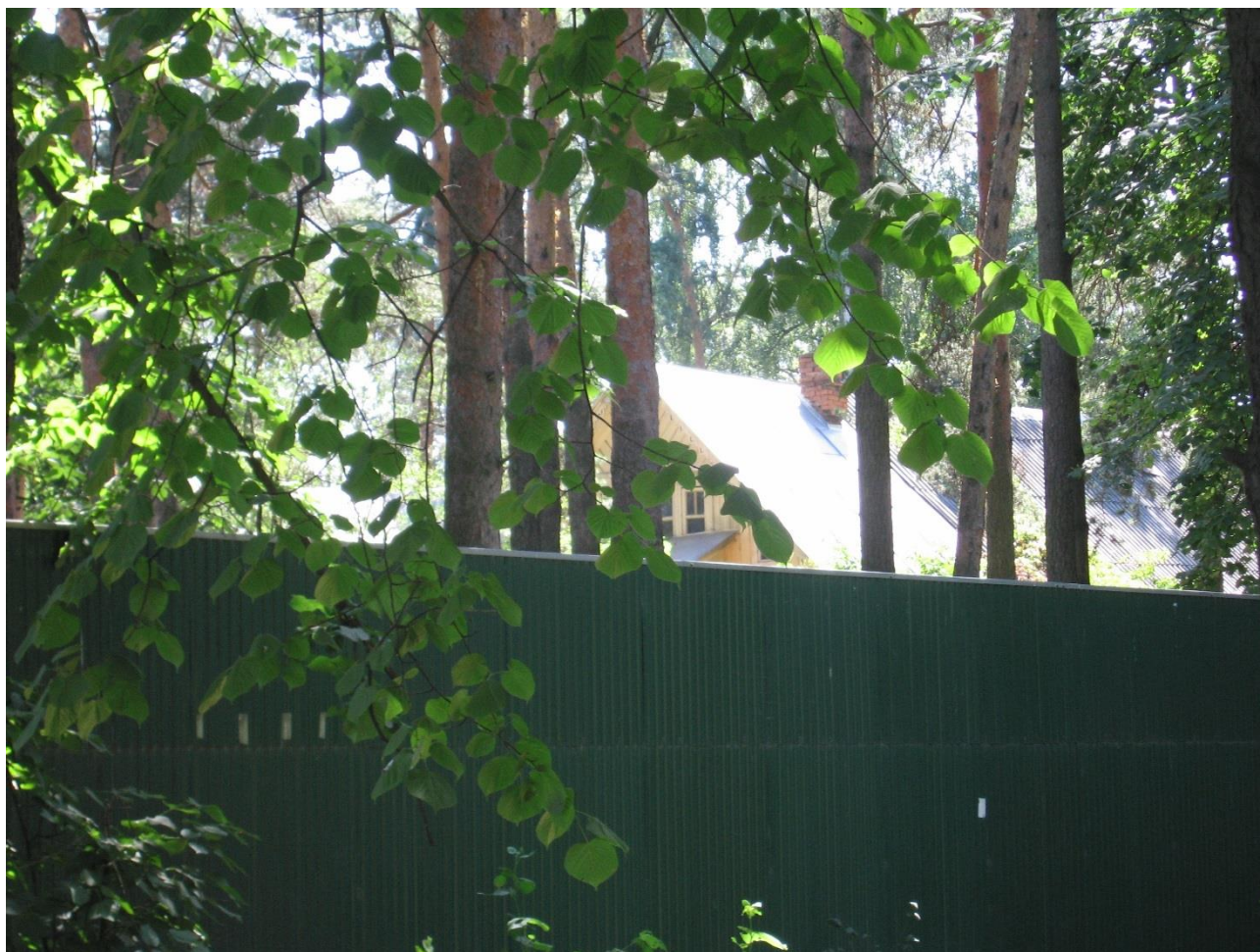
Вид на крышу памятника с северо-западной стороны