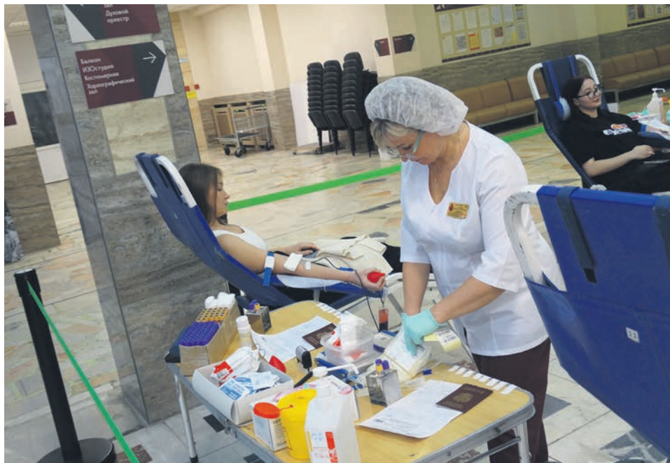
В ДК им. Воровского прошёл молодёжный день донора