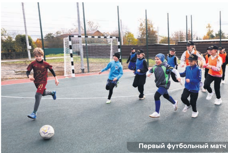
Первый футбольный матч