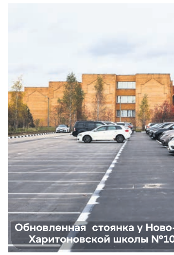
Обновленная стоянка у Ново-Харитоновской школы №10

ния работ. На данный момент заменены системы канализации, электрики, залиты цоколь и отмостка, сейчас проводится отделка внутренних помещений танцевального зала, холла, санузлов, осуществляется черновая стяжка пола, ремонтируются входная группа и аварийный выход.